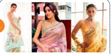
साड़ी को कीजिए कुछ ऐसे ढंग...